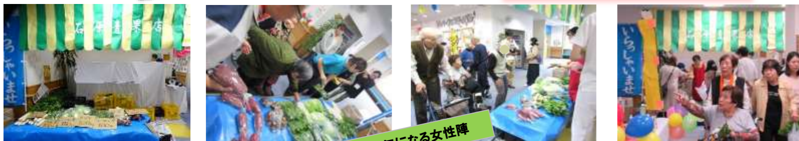
新鮮な野菜が気になる女性陣

～オリンピックの他にも～ 昭和の再現コーナー 昭和の物展示 駄菓子屋さん 各種屋台 わたあめやさん 陶芸作品展示