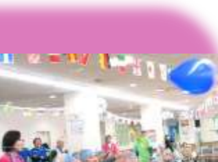
競技4 シッティングバレー