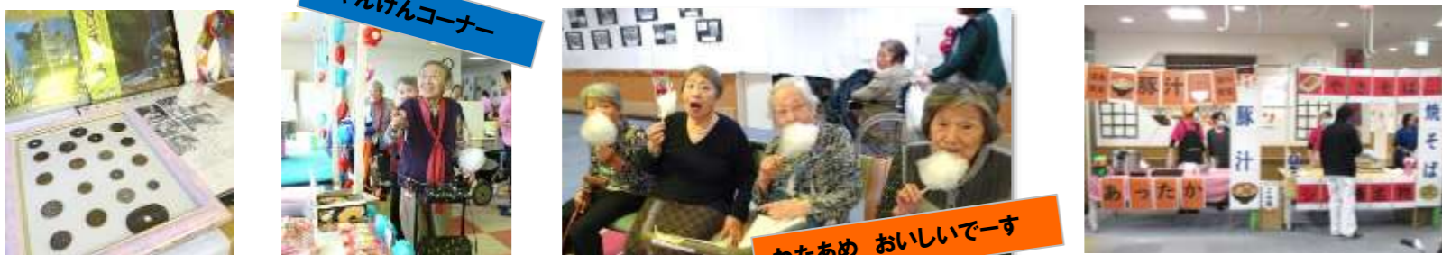
じゃんけんコーナー