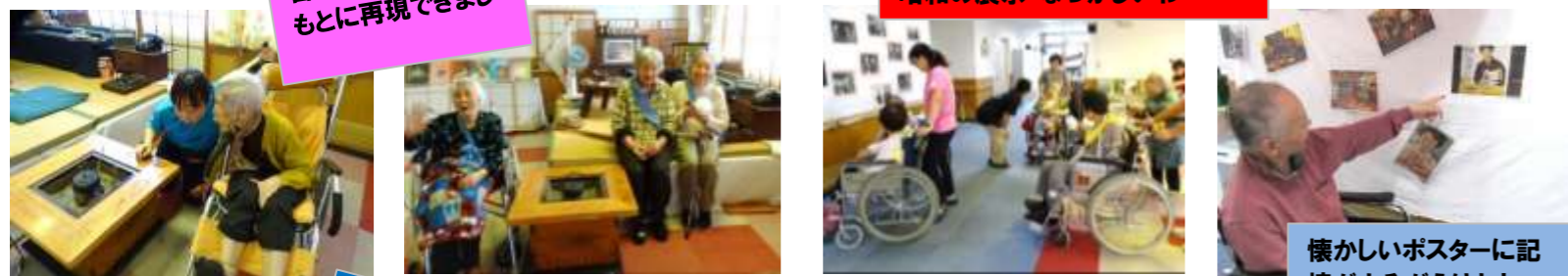
昭和の展示・なつかしいわ～