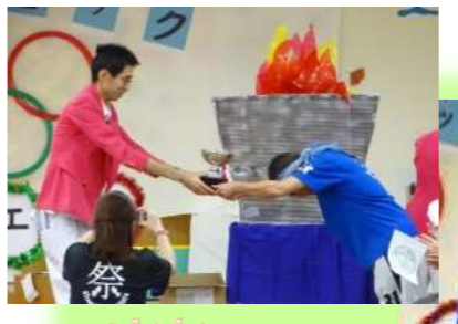
表彰式 【勝者】ネイ=白組 入所=2F