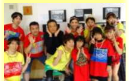
衣装も手作りで大好評でした♡