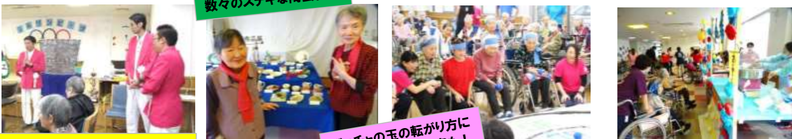
数々のステキな陶芸作品