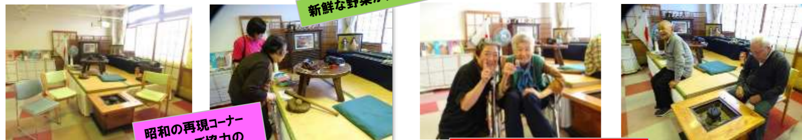
昭和の再現コーナー 皆さまのご協力のもとに再現できました